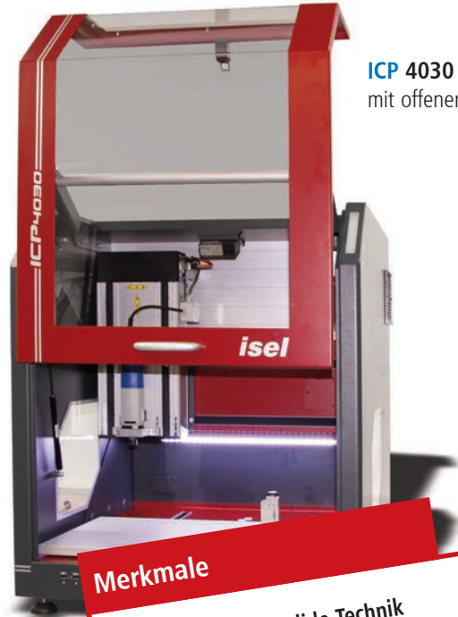
ICP 4030 mit offener Haube