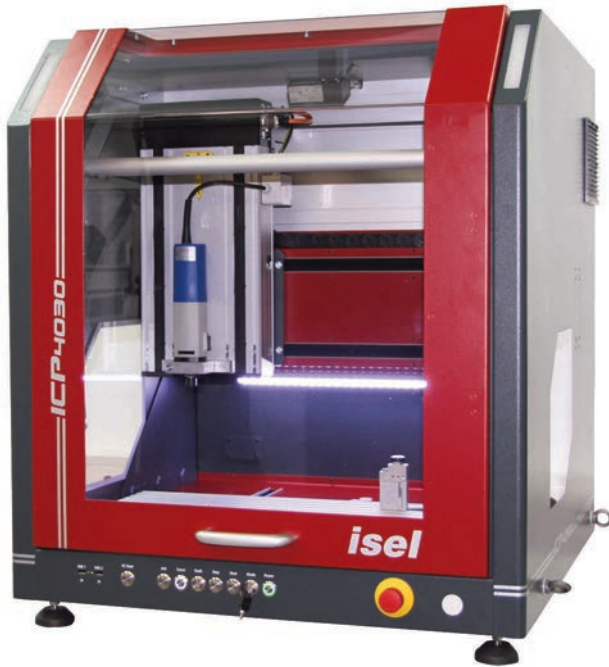
ICP 4030 mit geschlossener Haube

MECHANIKS - ELECTRONICS - SOFTWARE - SERVICE MADE IN GERMANY LIFETIME - DISPLAY - SERIALS