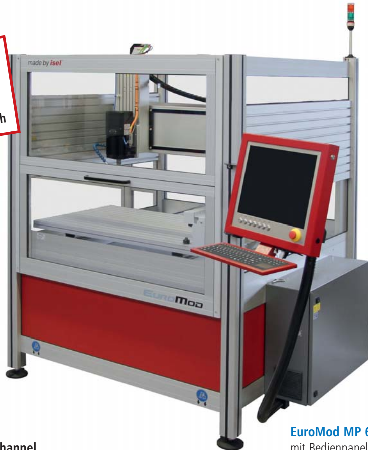
EuroMod MP 65 mit Bedienpanel iOP-19-TFT und geschlossener Schiebetür

Interessante Anwendungsvideos finden Sie auf unserem YouTube-Channel. Schauen Sie doch einfach mal rein!